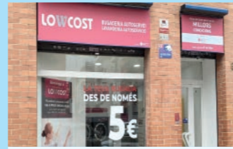
LOWCOST BUGADERIA AUTOSERVEI

C/ Bonaventura Pedemonte, 2 Local 2, 3, 4 direccionbonaventura@gmail.com Activitat: Centre dental