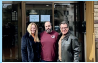
EL BON LLOC DE LA BIRRA

Plaçà de l'Església, 3 reformasgenerales1013@gmail.com Activitat: Empresa de reformes i instal·lacions