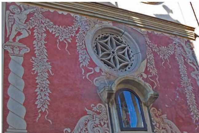
Foto: Façana de la Capella de Sant Joan