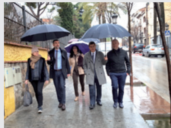
NI LA PLUJA VA FRENAR EL PASSEIG DEL CONSELLER PER MARTORELL