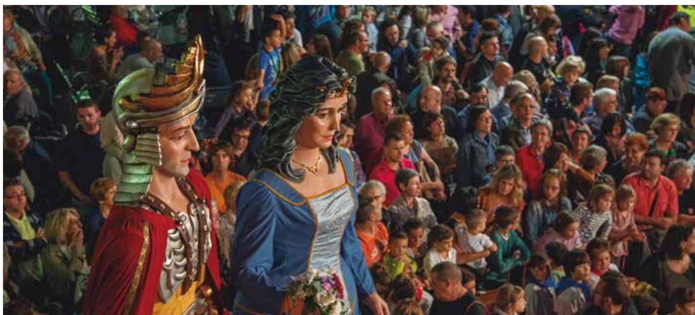
El cercavila va aplegar a una munió d'assistents pels carrers.

El pregoner va elogiar el Vimart perquè fa possible que “els nostres vins es coneguin més i millor, i tornem a ser un referent de promoció del vi català per assegurar-nos un futur esperançador” .