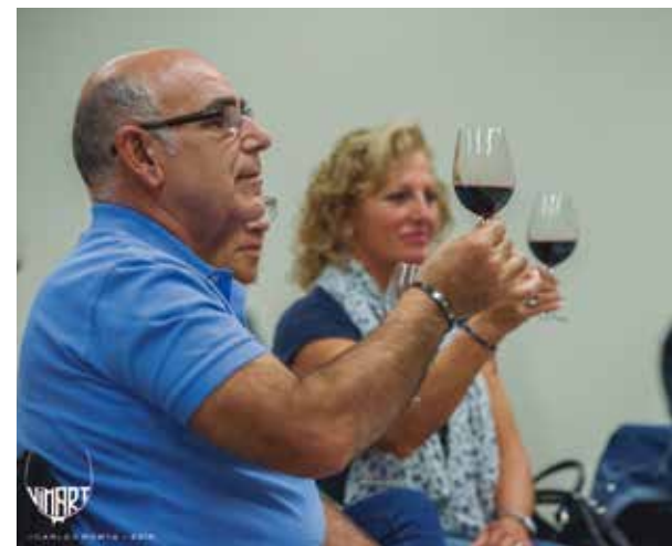
Els Racons del Vimart, propostes ben rebudes.

El Vimart va oferir un ampli espai, al voltant de la plaça de l'Església, amb la participació de diferents cellers i caves de les denominacions d'origen Catalunya i Penedès, de la qual Martorell forma part. La Fira també va oferir l'oportunitat única als visitants de tastar vins i caves d'alguns dels millors cellers del país, alhora que podien fer un tast de l'àmplia proposta gastronòmica.