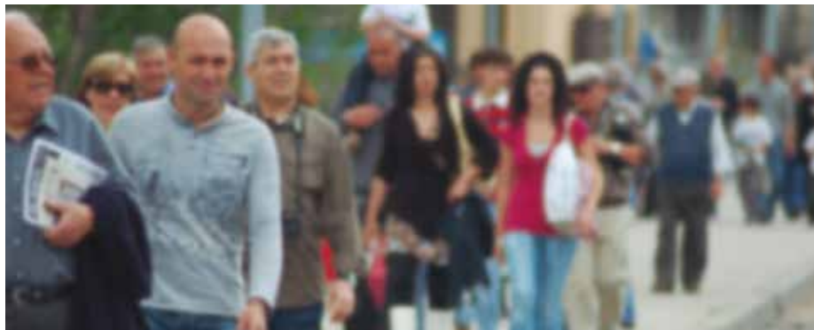
L'Ajuntament manté els ajuts a les famílies de Martorell.

Els ajuts són per atendre els subministraments energètics i d'aigua. L'import total màxim de la convocatòria és de 100.000 euros i el termini de sol·licitud acaba el 31 de desembre.