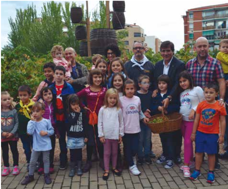
Els infants van gaudir trepitjant el raïm.