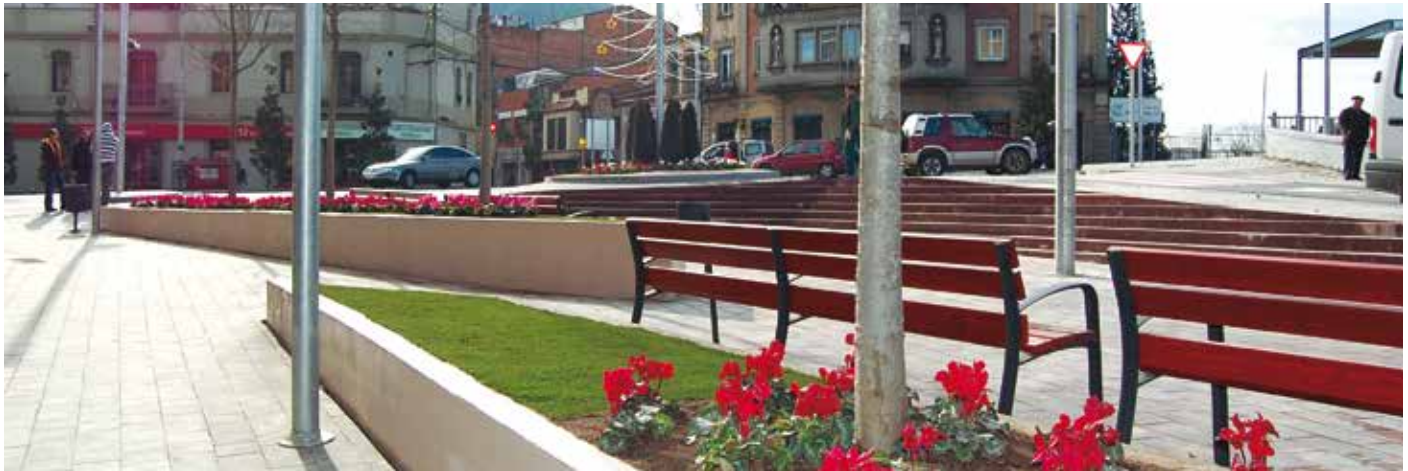
El govern municipal ha presentat el Pla d'Actuació Municipal.

El Pla d'Actuació Municipal (PAM) de Martorell és l'eina que recull les accions més rellevants que ha de desenvolupar l'equip de govern al llarg del seu mandat. El document organitza les actuacions previstes en cinc grans eixos: atenció a les persones, represa econòmica, regeneració democràtica, ordenació del territori i eix nacional.