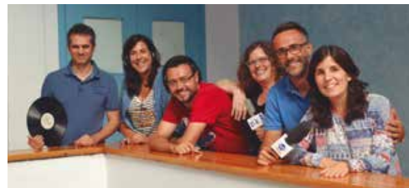
Els treballadors de Ràdio Martorell.