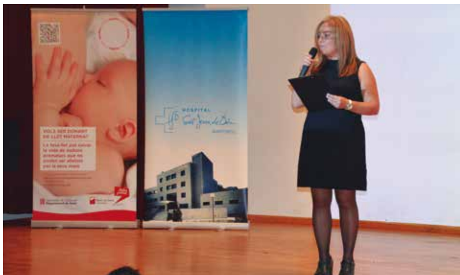
Cloenda de la setmana de la donació de llet materna.

La llet materna és el millor aliment que pot rebre un nadó, ja que és molt més completa que qualsevol altra alternativa.