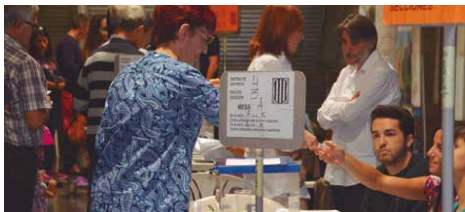
JxSí va ser la força més votada a Martorell.

La participació a Martorell en aquestes eleccions es va situar en el 75,72%, prop de dos punts per sota de la mitjana catalana. Van votar 13.875 dels 18.323 martorellencs i martorellenques cridats a les urnes, que representa un 7,16 punts per sobre de la darrera contesa electoral al Parlament de Catalunya, celebrada el novembre de 2012.