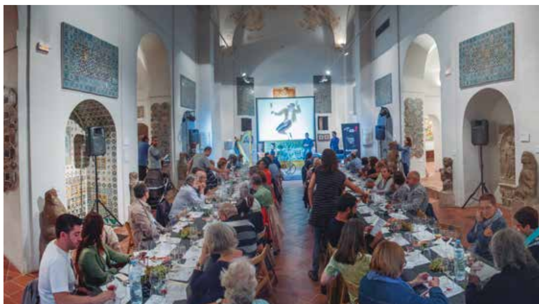
La Fundació Pujols va fusionar la música, el vi i la xocolata per recordar la figura del filòsof.