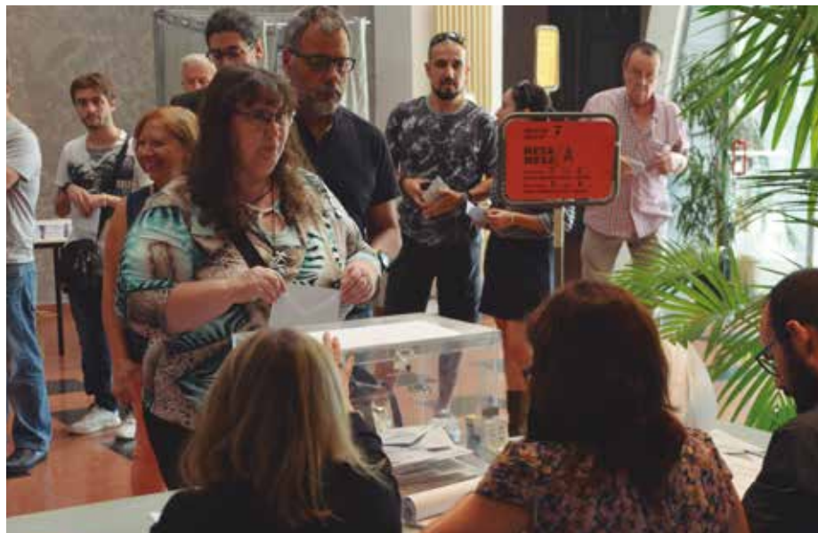
La participació a Martorell va ser del 75,72%.

Junts pel Sí va ser la força més votada a Martorell en les eleccions al Parlament de Catalunya celebrades el 27 de setembre passat, en les que la participació ha registrat un rècord històric des de l'arribada de la democràcia, amb un 75,72%.