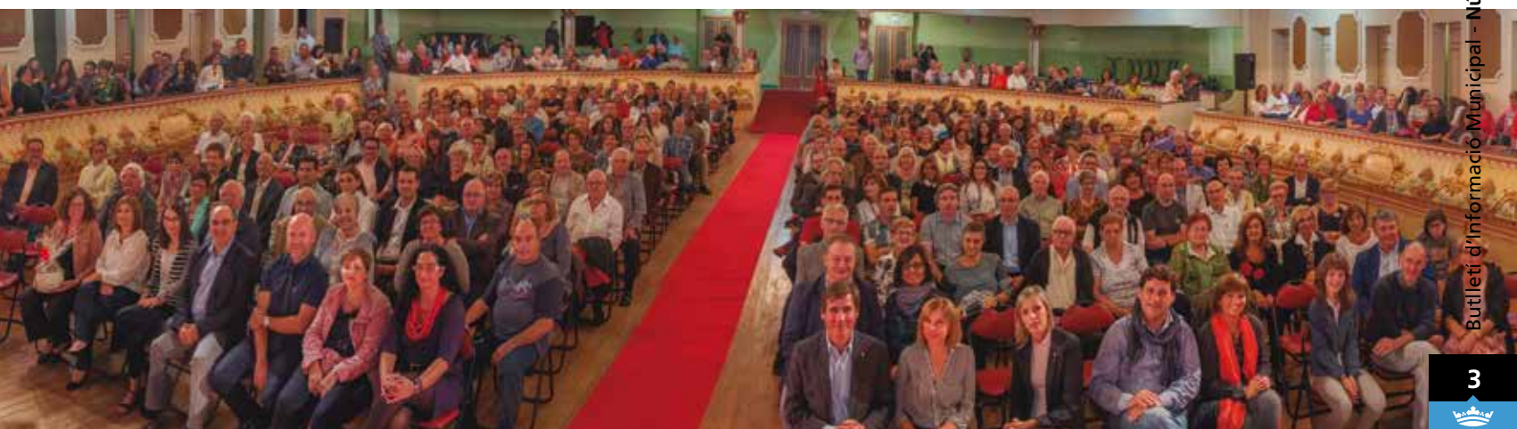
Panoràmica d'El Progrés en la XX Trobada d'Entitats.