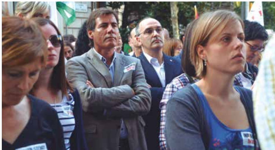
Els treballadors de l'empresa tenen el suport del consistori.

Arran d'una resolució del Ministeri d'Indústria i Energia que deixa a la planta de Martorell fora de la subhasta elèctrica, els grups municipals fan front comú al costat dels treballadors