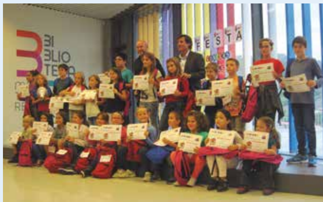
Els premiats del Concurs de Superlectors.

El primer Concurs de Superlectors de la Biblioteca Martorell ha tingut la participació de 182 nens i nenes, dels quals 28 van ser premiats. Durant quatre mesos els infants han hagut de llegir fins a una vintena de llibres. El Concurs de Superlectors és un certamen de lectura infantil amb l'objectiu de fer llegir com més llibres millor. Es divideix en tres categories: el grup blau (de 5 a 6 anys), el grup vermell (de 7 a 10 anys) i el grup verd (d'11 a 14 anys). La lectura afavoreix un millor desenvolupament afectiu i psicològic dels infants, i també els dona l'oportunitat d'experimentar sensacions i sentiments amb els quals gaudeixen, maduren i aprenen. L'alcalde de Martorell, Xavier Fonollosa, va lliurar els diplomes a la trentena de premiats.