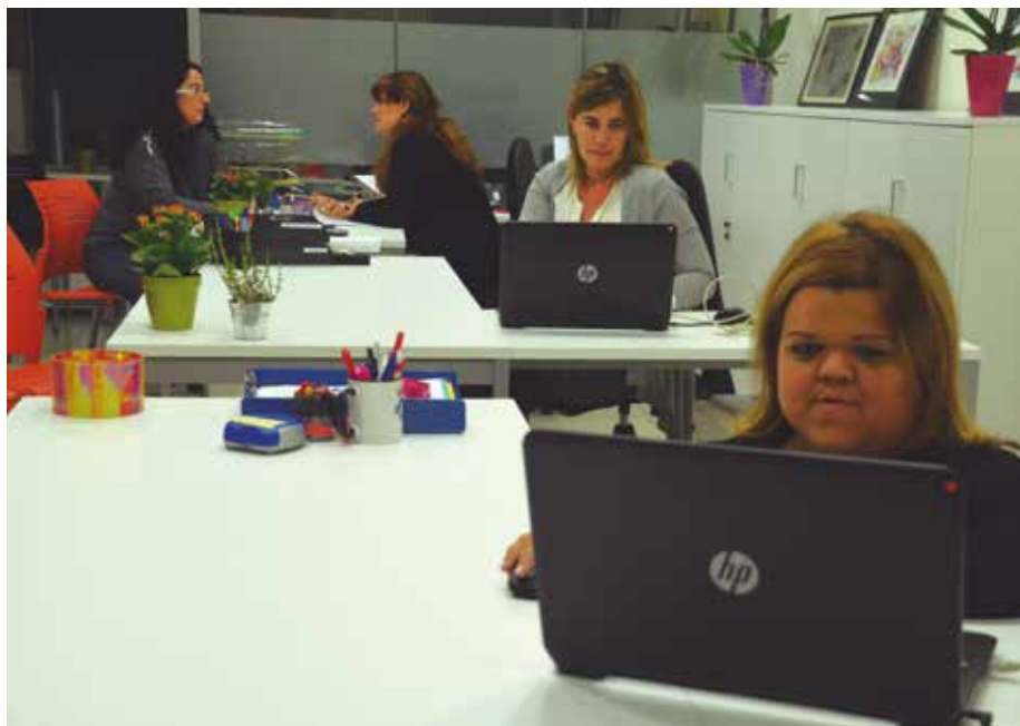
El Círcol pretén dinamitzar la Vila.

L'emblemàtic edifici de la Vila, construït l'any 1917, acollirà un servei d'assessorament a les entitats i espais per fer-hi reunions i activitats. L'equip de govern vol que la reobertura del Círcol actui com a motor dinamitzador de la Vila.