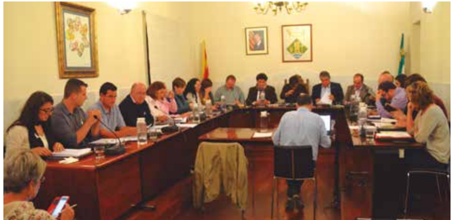
L'equip de govern municipal ha congelat els impostos i taxes.