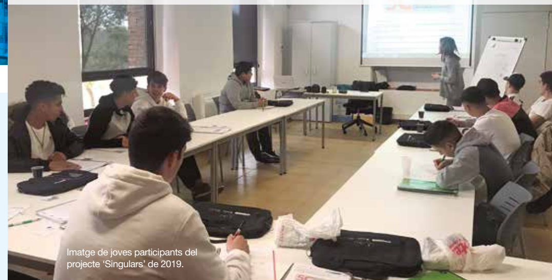
Imatge de joves participants del projecte 'Singulars' de 2019.

El projecte 'Singulars 2020. Jove, tu decideixes' és un programa d'ocupació dirigit a persones joves, d'entre 16 i 29 anys, de tots els nivells formatius, no ocupades i no integrades en els sistemes d'educació o formació.