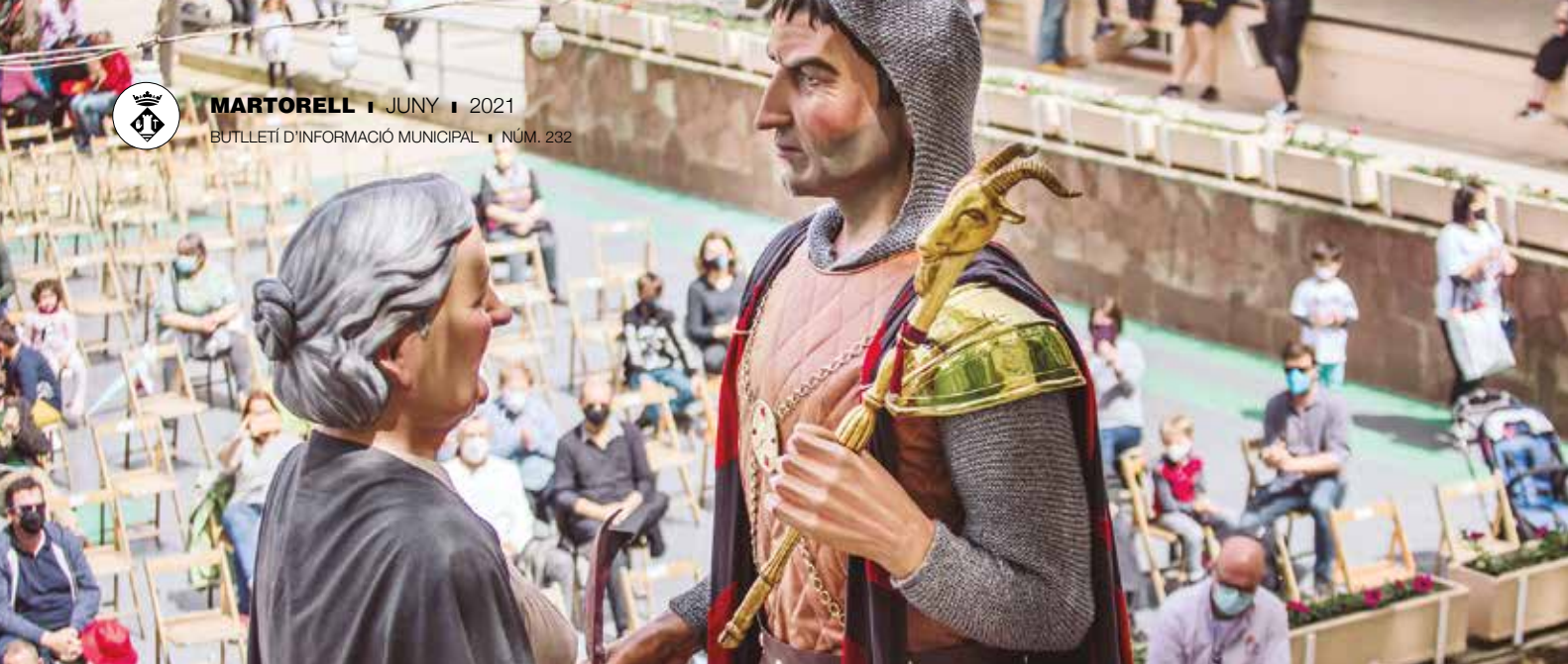
LA MOSTRA DE BALLS DE CULTURA POPULAR DE MARTORELL VA COMPTAR AMB LA PARTICIPACIÓ DEL GEGANTS, ELS CAGROSSOS, LA COLLA DE DIABLES I DRAC I ELS BASTONERS DE MARTORELL I LA MARTUKADA.