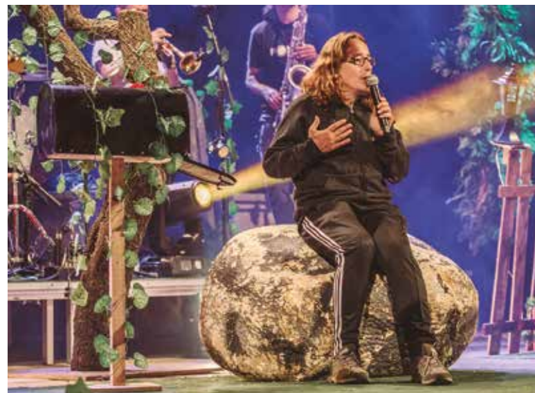
ESPECTACLE DE BUHOS. TERÀPIA COLECTIVA