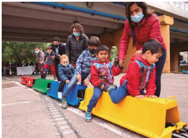
TRENET A LA FIRA PRIMAVERA