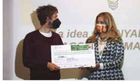
LA REGIDORA DE PROMOCIÓ ECONÒMICA, COMERÇ I TURISME VA FER ENTREGA DEL PREMI DE 2500 EUROS I UN ANY D'ALLOTJAMENT GRATUÏT AL VIVER DEL MOLÍ D'EMPRESA.