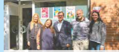
AUTHENTIC ENGLISH TEENS & KIDS

Activitat: L'Angel és un jove emprenedor que, després d'anys dedicant-se a la informàtica, ha obert aquest negoci de venda i reparació d'ordinadors.