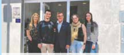
SENTINEL PRIME INFORMÀTICA

Activitat: Botiga d'alimentació amb secció de peixateria amb forn de cocció de peix, fruiteria, xarcuteria, formatgeria, fleca d'autoservei i carn.