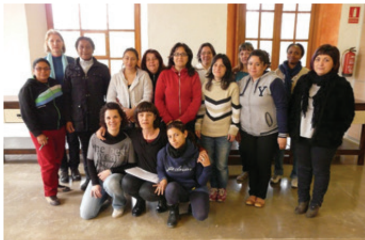
LA QUINZENA DE DONES QUE PARTICIPEN AL CURS DE NETEJA DEL PROGRAMA 'OCUPA'T'