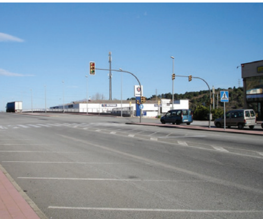
NOVA ROTONDA AL CONGOST PER MILLORAR LA CIRCULACIÓ DE VEHICLES

Encara estan obertes les inscripcions al programa d'activitats infantils d'estiu 2013. Són un conjunt d'activitats educatives i lúdiques que es duran a terme del 25 de juny al 2 d'agost i que organitza