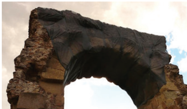
ACABADA LA PRIMERA FASE DE RESTAURACIÓ DE L'ARC ROMÀ DEL PONT DEL

acabar el curs, se'ls farà entrega d'un certificat de professionalitat. Els programes Ocupa't Dones i Ocupa't Joves tenen una durada de deu mesos i estan subvencionats pel Servei d'Ocupació de Catalunya (SOC) i el Fons Social Europeu.