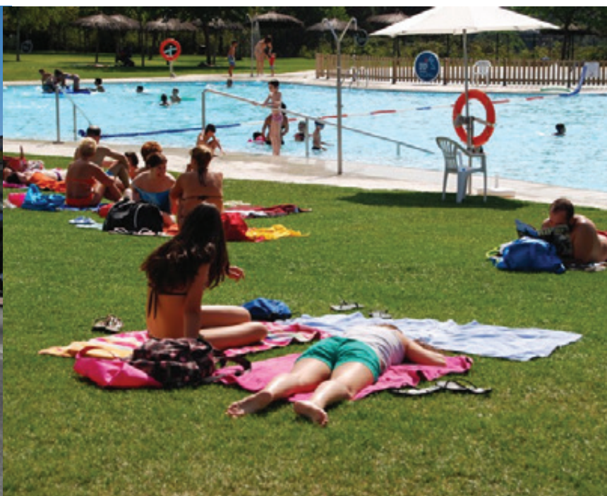
LA PISCINA D'ESTIU COMPLEIX 15 ANYS DE LA SEVA INAUGURACIÓ