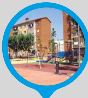
Reurbanització de les places del barri Verge del Carme: plaça Sant Jordi, plaça Verge de Núria i plaça Sant Jaume