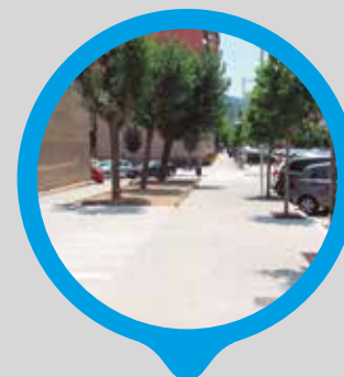
Remodelació de tota l' avinguda Bonaventura Pedemonte i el seu entorn