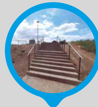
Millora del camí per a vianants que uneix Can Cases, Torrent de Llops i La Sínia