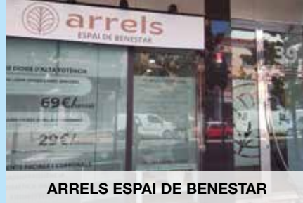
ARRELS ESPAI DE BENESTAR

📍 Carretera de Piera, 39 ☎ 93 516 03 13 📧 @arrelsenestar