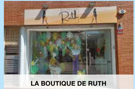
LA BOUTIQUE DE RUTH

📍 C/ Puig del Ravell, 2 📧 @la_boutique_de_ruth