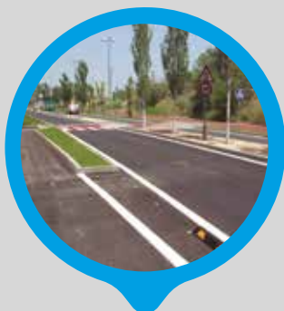
Nova via ciclista i itinerari de vianants d'accés al Polígon Can Bros