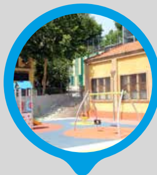
Adequació de la plaça Maria Canela i millora de la connexió amb el passeig de Catalunya