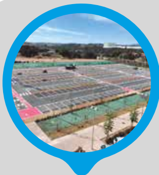
Nou aparcament de La Sínia amb 303 places gratuïtes