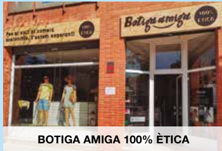
BOTIGA AMIGA 100% ÈTICA

Activitat: Venda al detall de llaminadures